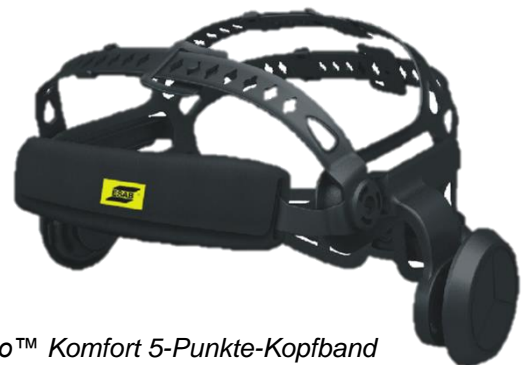
Halo™ Komfort 5-Punkte-Kopfband (Vorderansicht)

Weitere Informationen erhalten Sie auf esab.de