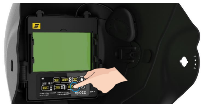
Hohe optische Klasse ADF, mit Farb-Touch-Screen Interface