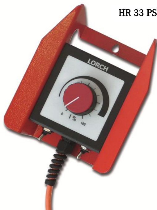
HR 33 PST